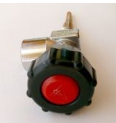
Zawór pojedynczy AUER DIN 300 bar gwint do butli M18X1,5