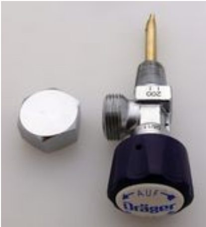
Zawór pojedynczy DRAGER TLEN 200 bar gwint do butli stożek 17E