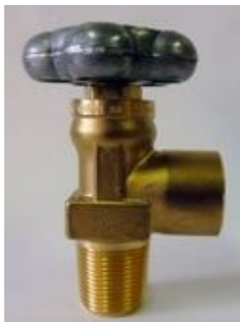
Zawór pojedynczy techniczny DIN 300 bar gwint do butli stożek 25E